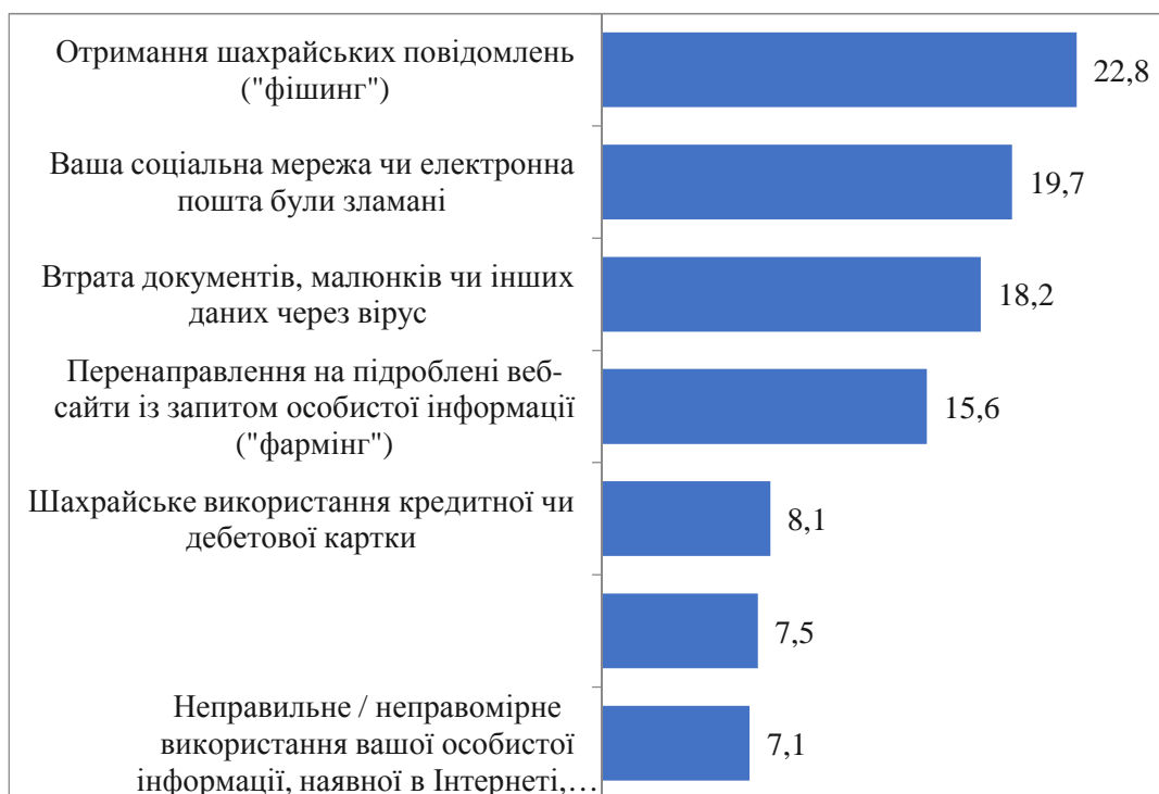
Рисунок 1. Небезпечні ситуації, з якими стикаються діти в Internet

На сьогодні постає дуже важливе питання інформаційно-психологічної безпеки, адже захоплення інформаційними технологіями та відсутність необхідних навичок прогнозування ризиків у мережі може стати причиною небезпечних ситуацій у реальному житті, а саме насилля.