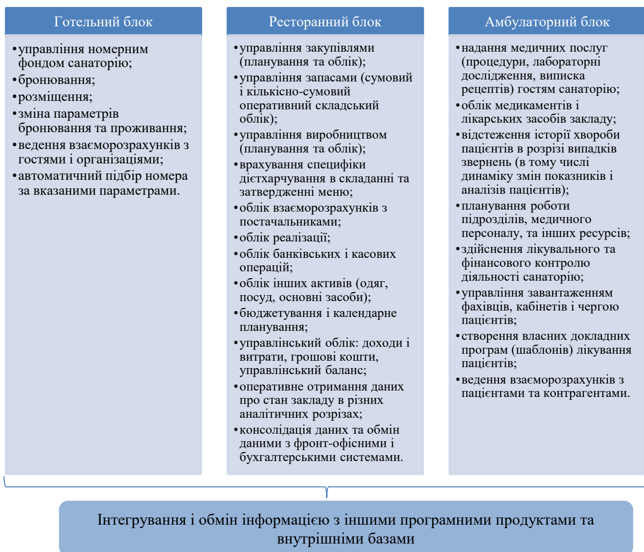
Рисунок К.1 – Автоматизація різних блоків операційної діяльності та можливості програмного продукту