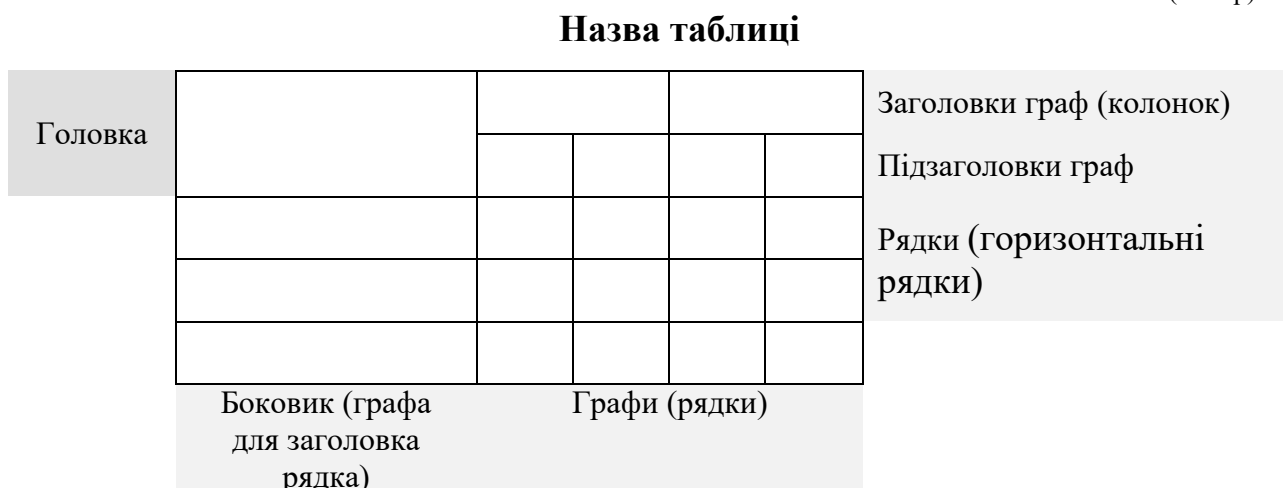
Рисунок 3.2 – Структурна схема таблиці

Горизонтальні та вертикальні лінії, які розмежовують рядки і колонки таблиці, а також лінії зліва, справа і знизу, що обмежують таблицю, можна не проводити, якщо їх відсутність не ускладнює користування таблицею.